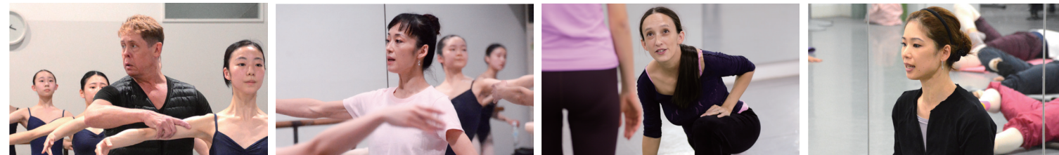
Michael Shannon マイケル・シャノン